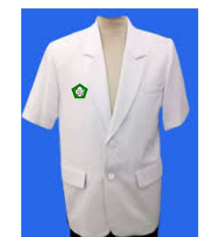
Gambar 1 : Pakaian Dinas